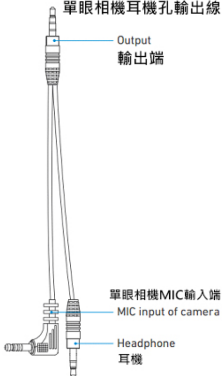
單眼相機耳機孔輸出線